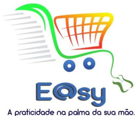
FIGURA 1 - Logomarca E@sy

A E@sy será uma empresa projetada para atuar no mercado itaunense propiciando ao consumidor local comodidade, praticidade e agilidade no momento da realização de suas compras em supermercados. O conceito dessa empresa surgiu através de informações mercadológicas a respeito do descontentamento de uma parcela considerável de consumidores com a ida aos supermercados. Segundo pesquisa realizada pela startup Superlist, citada no portal brasileiro E-Commerce News em 27/09/2017, uma a cada quatro pessoas em grandes cidades não têm prazer em fazer compras em supermercados e 12% dos clientes preferem evitar a ida a esse estabelecimento. Tal fato, aliado à revolução tecnológica contemporânea que impulsiona o surgimento estratosférico de startups e empresas virtuais, são os fatores propulsores da atividade empresarial da E@sy. A FIGURA 1 ilustra a logomarca da empresa.